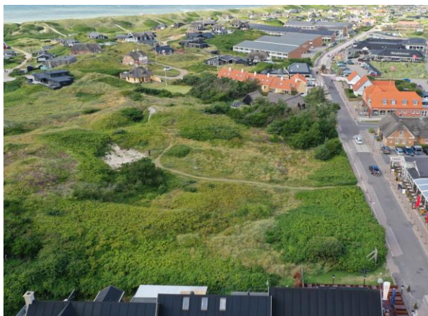
Dronebillede af området. Lodbergsvej ses til højre i billedet.

Lokalplanområdet er stort set ubebygget, hvor et mindre sommerhus blev nedrevet i 2021. Den nordligste del af lokalplanområdet omfatter et eksisterende sommerhus.