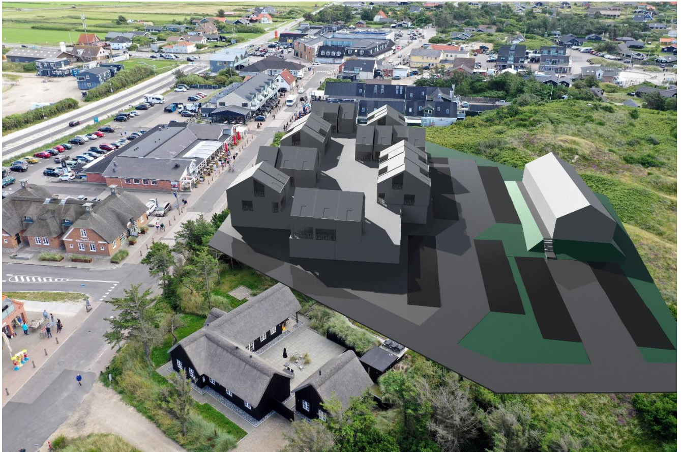
Lokalplanområdet vist fra nord mod syd