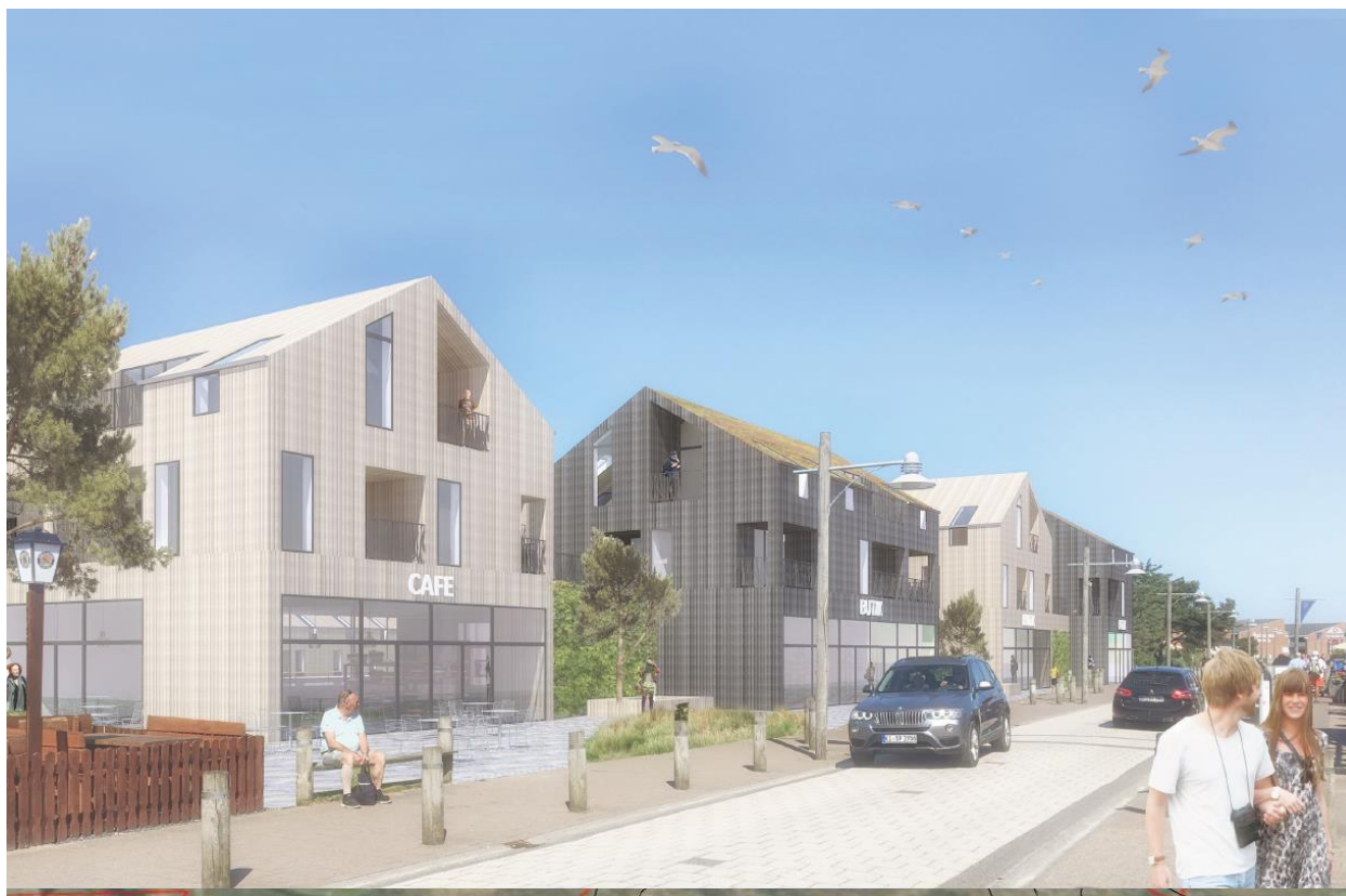
Skitsen viser, hvordan projektet kan se ud, set fra syd langs Lodbergsvej. Skitsen viser mindre klitter langs vejen for at skabe en grøn forbindelse ind i lokalplanområdet.

Delområde I udlægges til ferieboliger, hoteller, sommerhusbebyggelse, detailhandel, café/restauranter og lignende.