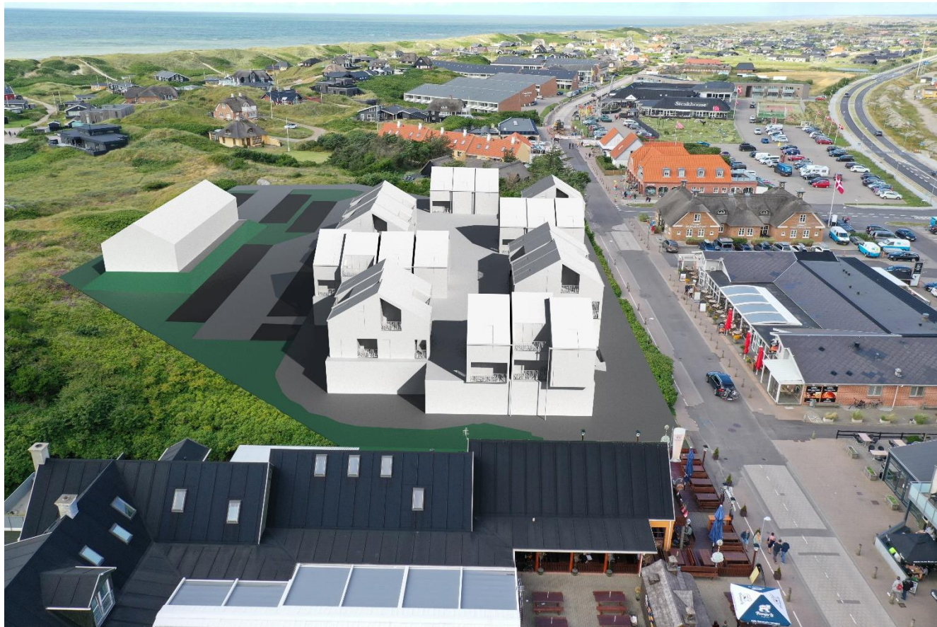
Lokalplanområdet vist fra syd mod nord