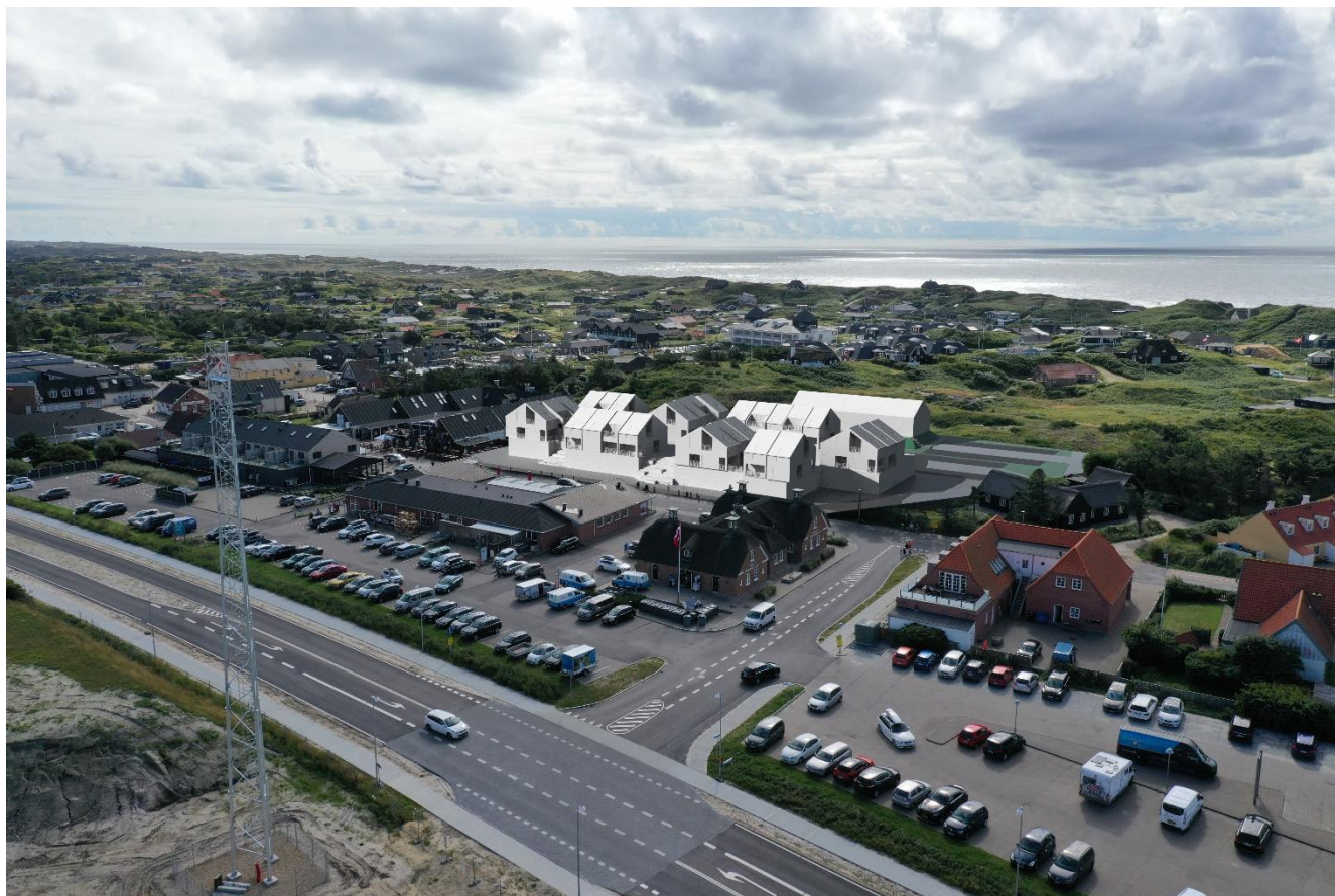
Lokalplanområdet vist fra nordøst mod sydvest