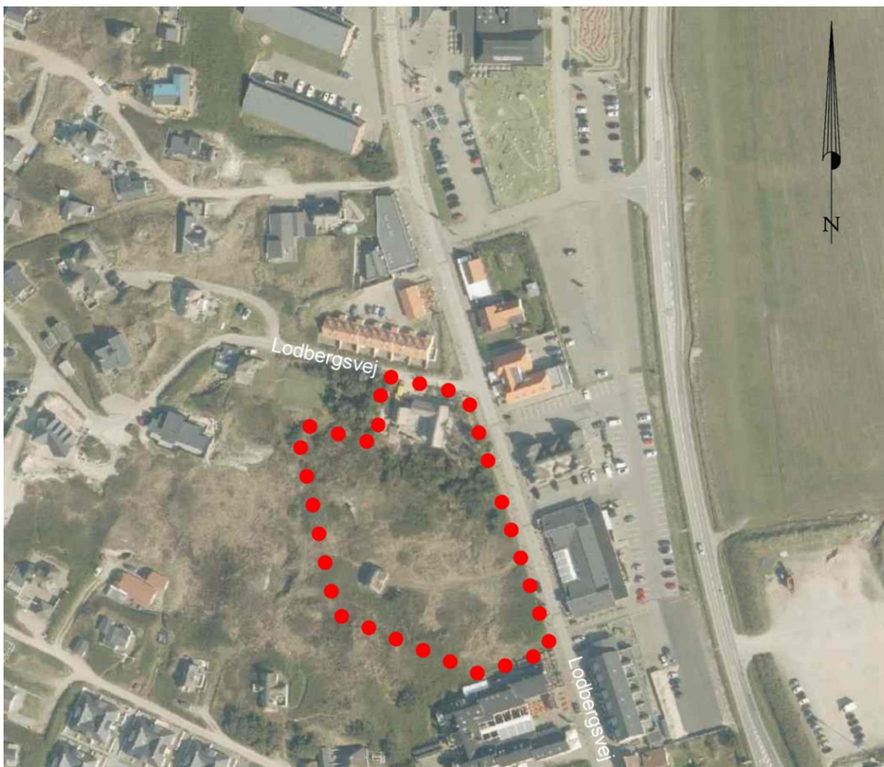
Lokalplanområdets afgrænsning. Luftfoto fra 2019.