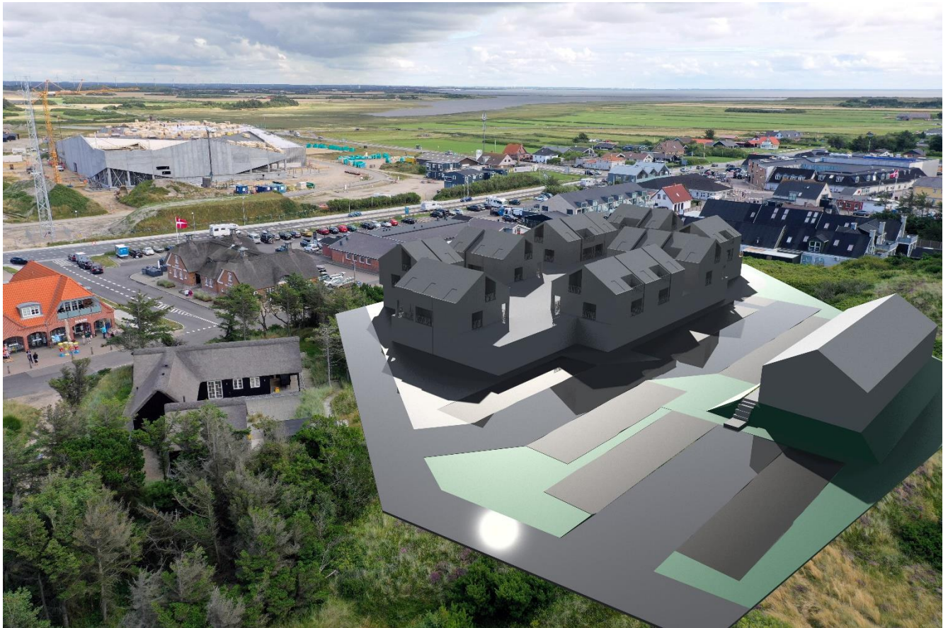
Lokalplanområdet vist fra nordvest mod sydøst