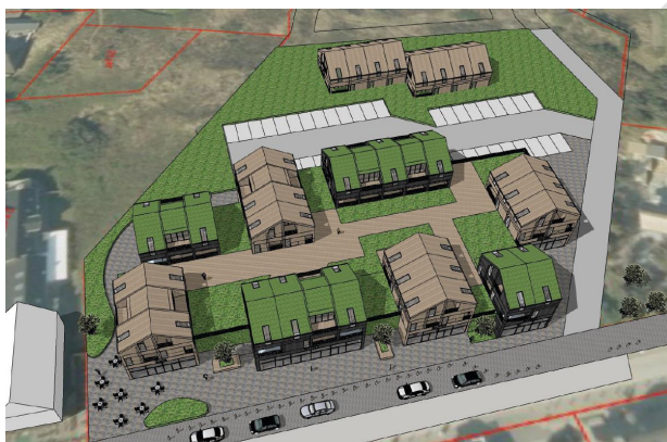
Skitsen viser et overview af lokalplanområdet. Set fra øst mod vest.

I området tillades terrænregulering i et omfang, som er nødvendigt for at sikre hensigtsmæssig vandafstrømning i skybrudssituation samt tilgængelighed fra veje til bebyggelser. Terrænet skal desuden håndteres ved den enkelte bebyggelse, således der kan sikres niveaufri adgang, jf. bygningsreglementet