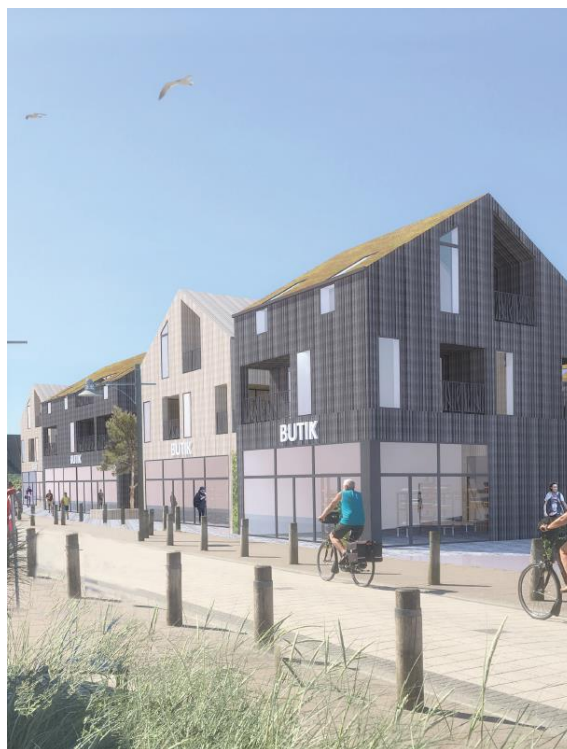
Projektskitse af lokalplanområdet. Set fra nord langs Lodbergsvej

Området inddeles i tre delområder, som vist på kortbilag 3.